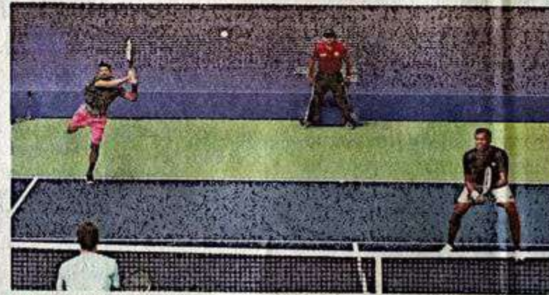
Huge void: 2024 will be the first year without the annual dose of top-level tennis in India.