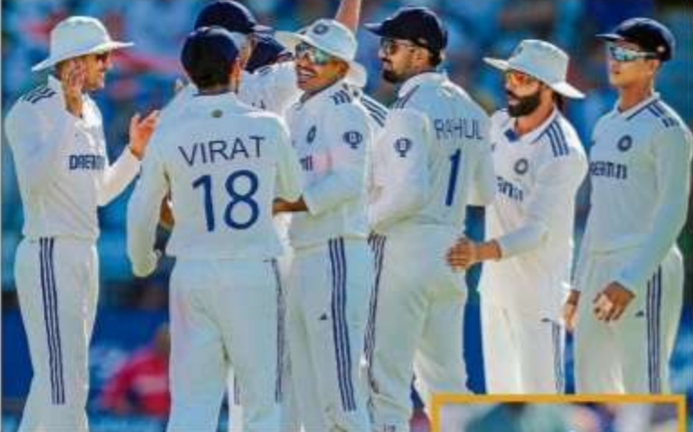
ದಕ್ಷಿಣ ಅಫ್ರಿಕಾದ ವಿಕೆಟ್ ಪಡೆದ ಸಂಭ್ರಮದಲ್ಲಿ ಭಾರತ ತಂಡದ ಆಟಗಾರರು

ಭಾರತ ವಿರುದ್ಧ ಕನಿಷ್ಠ ರನ್ ದಾಖಲೆ: ದಕ್ಷಿಣ ಅಫ್ರಿಕಾ ಮೊದಲ ಇನಿಂಗ್ಸ್‌ನಲ್ಲಿ ಗಳಿಸಿದ 55 ರನ್ ಭಾರತದ ವಿರುದ್ಧ ತಂಡವೊಂದು ಗಳಿಸಿದ ಕನಿಷ್ಠ ಮೊತ್ತ ಇದಾಗಿದೆ. 2021ರಲ್ಲಿ ನ್ಯೂಜಿಲೆಂಡ್ ತಂಡವು 62 ರನ್‌ಗೆ ಆಲ್‌ಔಟ್ ಆಗಿದ್ದು ಈ ವರೆಗಿನ ದಾಖಲೆಯಾಗಿತ್ತು.