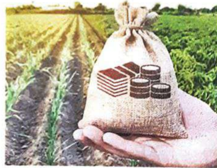
FARM FUNDS. Digital path

* Digitalising value chain activities leverages farmer-buyer relationships,