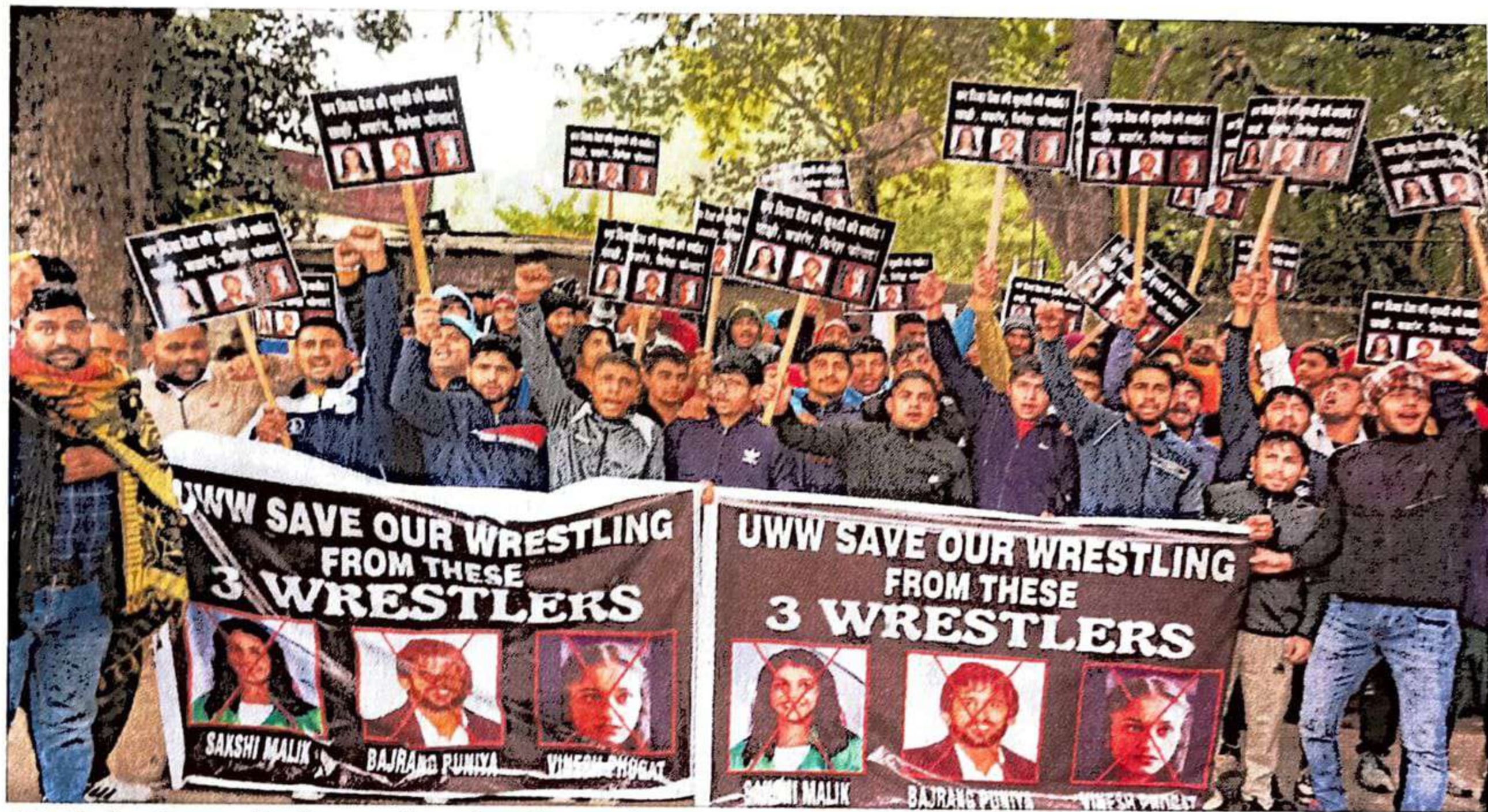
Hundreds of peeved junior wrestlers staged a surprise protest at Jantar Mantar in New Delhi on Wednesday against the loss of one crucial year of their careers owing to the ongoing crisis in WFI. PTI

ing banners that read: 'UWW (United World Wrestling) save our wrestling from these 3 wrestlers'.